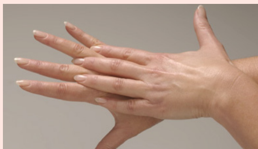
... sorgfältig zwischen den Fingern ...