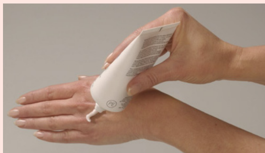
Zuerst auf die Handrücken auftragen ...

Hautschutzpräparate sind spezielle Cremes, die einen zweiten, künstlichen Schutzfilm über die Haut legen und damit – zeitlich begrenzt – Schutz gegen Feuchtigkeit und waschaktive Substanzen bieten. Welches Präparat angewendet werden sollte, hängt von Tätigkeit und Hauttyp ab. Eine Empfehlung für ein geeignetes Präparat erhalten Sie bei Ihrem Betriebsarzt, Ihrem Hautarzt oder bei der BGW! Hautschutzmittel sollten vor Arbeitsbeginn und nach jedem Händewaschen benutzt werden!