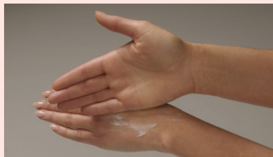
... Handrücken gegeneinander reiben ...

Nach der Tätigkeit sollten Sie die Hände mit einem Hautpflegemittel eincremen. Die Hautpflege unterstützt die Erholung der Haut in der belastungsfreien Zeit, sie bleibt geschmeidig und elastisch. Dadurch wird ihre Widerstandsfähigkeit gegenüber natürlichen Umwelteinflüssen gestärkt. Wählen Sie möglichst ein Präparat ohne Duft- oder Konservierungsstoffe!